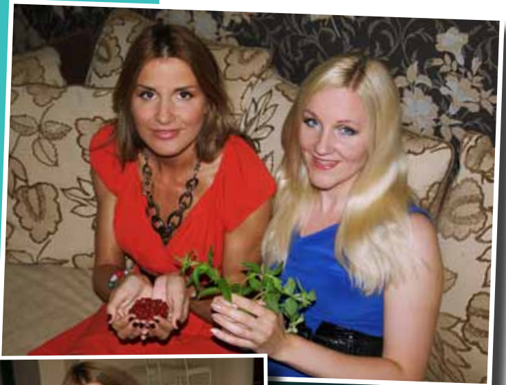
Reet maasikamaski peale panemas

Toime. Mask toidab ja kosutab ning on ideaalne meigi aluseks - hooldavat kreemi polegi vaja, nägu on puhanud ja värske.