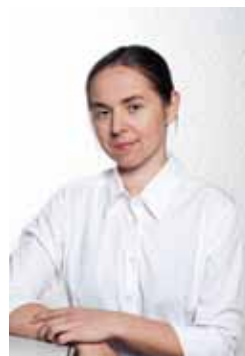
Tagli Pitsi Tervise Arengu Instituudi tootumisekspert

Oma nõuandeid ja retsepte jagavad ka paljud meie tuntud inimesed. Võib-olla on nende antud retseptide seas mõni selline, mis kutsub sindki katsetama? Loodame, et Köögika pakub kõigile häid ideid köögis toimetamiseks. Head lugemist ja head isu!