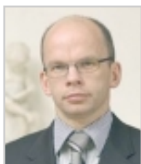
Allar Jõks Eesti Vabariigi õiguskantsler

Kuigi sotsiaalministeeriumi eestvedamisel teostatud hooldajatoetuse reformist on juba mitu head aastat möödas, ei ole hooldajatoetuse maksmise teema oma aktuaalsust kaotanud. Ikka ja jälle tuleb mul isikute avalduste põhjal selgitada oma seisukohti ühele või teisele hooldajatoetuse maksmist reguleerinud kohalikule omavalitsusele, näidata ära kitsaskohad ja aida-ta leida lahendusi.