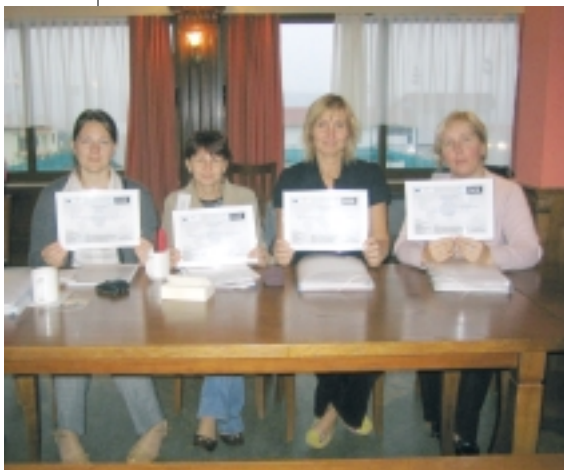
Bulgaarias koolitusel käinud Eesti hoolekandejuhid tunnistustega

timisest ja riskidest juhi/liidri töös. Tabel 1 annab ülevaate juhi ja liidri rolli erinevustest.