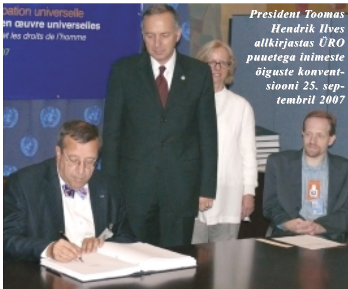
President Toomas Hendrik Ilves allkirjastas ÜRO puuetega inimeste õiguste konventsiooni 25. septembril 2007