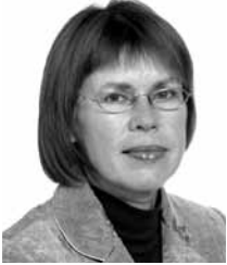
Kai Saks Tartu Ülikool

Geriaatrilise haige, samuti puudega inimese probleemid on tavaliselt väga mitmekesised, meditsiinilised probleemid põimuvad õendushoolduse ja hoolekande vajadusega. Iga üksik spetsialist võib oma tööd teha kui tahes hästi, kuid ilma toimiva professionaalse võrgustikuta jääb abi episoodiliseks ning abivajaja sageli rahulolematuks.