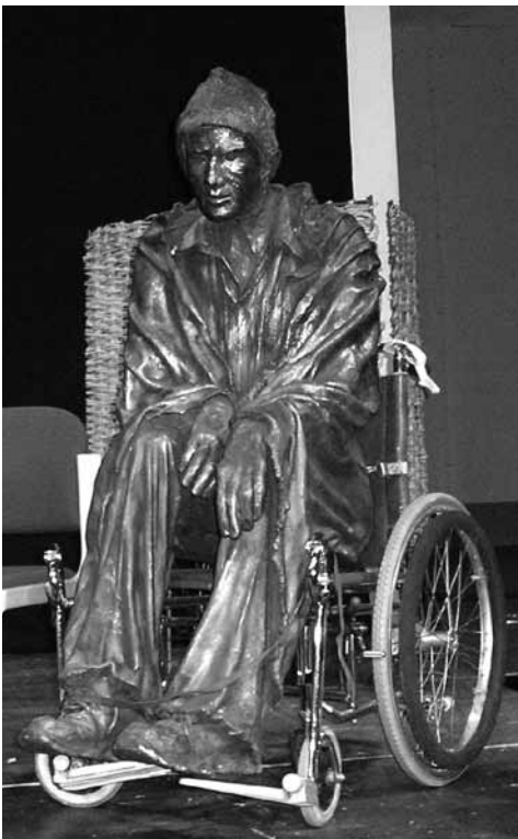
FEANTSA konverentsil kõitsid osavõtjate tähelepanu pronksi valatud kodutute kujud.

Tavaliselt toimub FEANTSA iga-aastane konverents oktoobris, iga kord eri riigis. 2009. a toimus see Taanis, Kopenhaagenis, kus mitme päeva jooksul oli võimalik kohapeal tutvuda nii riikliku poliitikaga kui ka kolmanda ja erasektori tegevusega. Kuna tegemist oli FEANTSA 20. aastapäeva tähistava sündmusega, oli konverents ka vormiliselt üsna elevust tekitav. See algas ühise laulmisega, lõppes teatriga ja kõik, mis selle vahele jäi, oli huvitav ja hariv.